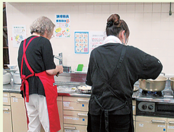
カレーと果物の準備中

十日市場地域ケアプラザを会場に月1回第3水曜日に行われている「ふれあい子ども食堂」にお伺いしました。メニューはカレーと副菜が月によって変わります。2022年にNPO法人ライフコミュニティセンターの声掛けで、地場産物を扱う緑区内の飲食店とタッグを組み活動が開始されました。“ふれあい”をテーマにボランティアさんと参加者が交流をしています。活動をしていて、子どもたちのお腹いっぱい満たされた顔・素の顔が見られて嬉しいと話されていました。 参加者が大幅に増え、運営方法は試行錯誤を繰り返しているそうです。必要としている方たちに届けられるよう、活動を応援・協力してくれる人の輪を広げたいと話してくださいました。