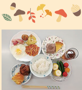
ある日の朝ごはん

東本郷地区では2022年から朝ごはんに限定をした「朝ごはんを食べる会」をオープンしました。東本郷地区内の小学校・中学校の先生からの「朝ごはんを食べない子どもが多い」という声がきっかけとなり、居場所づくりや見守りを行える子ども食堂をオープンすることになりました。現在は8名のボランティアさんが活動をされています。ボランティアさんは5時半頃に集まり、ご飯の用意をし、子どもたちへご飯を提供しています。また、食べ終わった子どもたちを学校へ送り出すのもボランティアさんがやられています。子どもたちへご飯を提供するにあたって、自治会や区社協からの助成や地域の方からの食材の寄付などを活用されています。「朝ごはんを食べる会」を通して子どもたちの成長を感じることができるのも嬉しいと話してくださいました。