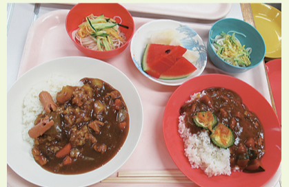
子ども用カレーにはウィンナーのクワガタ・大人用にはゴーヤを