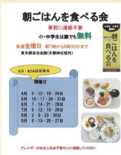
朝ごはんを食べる会のチラシ