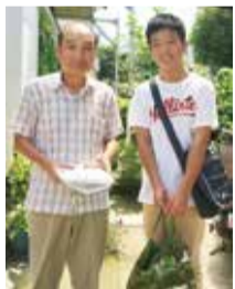
お弁当を届けた玄関先で笑顔でツーショット

「中学生の体験学習の受入れをして11年目になるが、貴重な体験をさせていただきました。ひとつは事前に生徒に心構えなどをきちんと学ばせていた学校の姿勢が素晴らしかった。ふたつめは、間に入った緑区社協が生徒を大切に、活動を見守ってくれたこと。わかば会は生徒の自由な発想を見守ったのみでした。しおりに目を通したか確かめたところ、「家に着くまでが体験学習です」と言っていたのが印象的でした。」そんな感想をいただきました。